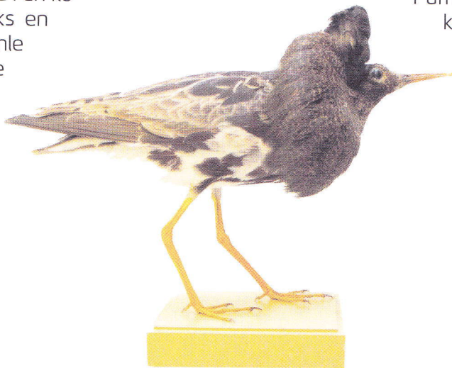
Smuk, men død brushane ( Philomachus pugnax ) dateret 8. maj 1909 Grund Fjord, Naturhistorisk Museum, Århus

Jeg har endnu ikke set dansende brushøns på Djursland. Den udstoppede stork "forsvandt" vist ved en sammenflytning med en kæreste, men jeg har et historisk maleri af dansende brushøns hængende i stuen. Afgrøderne står år efter år solidt på søbunden af Kolindsund med massiv EU bistand som deres udtømmelige næringslag. Pumperne pumper, enkelte lærker synger, og livet er skønt.